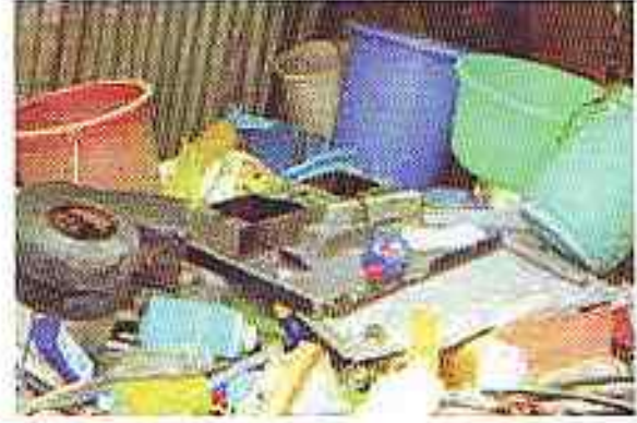
मच्छर प्रजनन स्थल