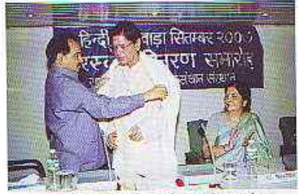
मुख्य अतिथि को सम्मानित करते हुए निदेशक महोदय