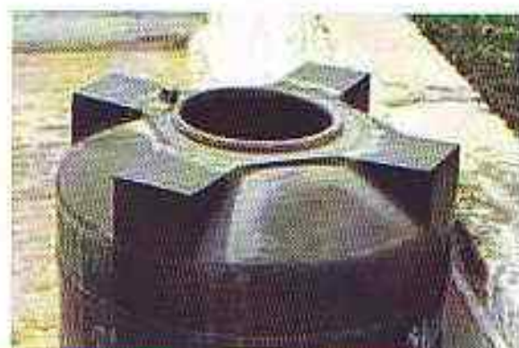
एडीज एजिप्टी मच्छर के प्रजनन स्थल