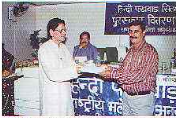
जाय-विवाय प्रतियोगिता (कर्मचारी वर्ग) का पुरस्कार लेते हुए