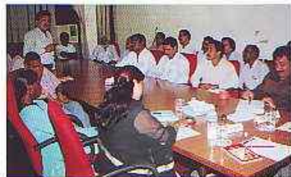
वाद-विवाद प्रतियोगिता (कर्मचारी वर्ग) में भाग लेते प्रतिযোগी