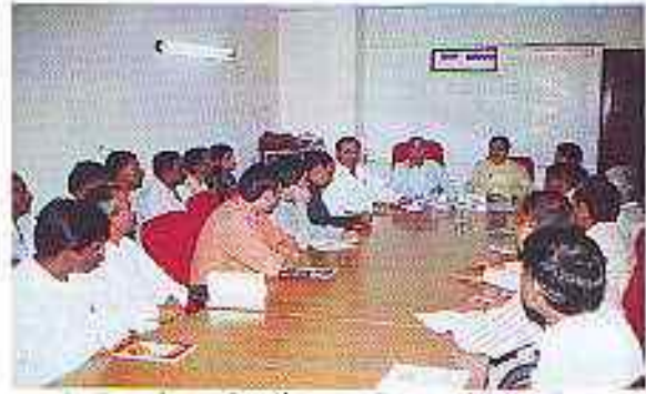
हिन्दी कार्यशाला में संबोधित करते हुए निदेशक महोदय

इसी क्रम में चलते हुए दिनांक 21 सितम्बर 2007 को अपराह्न 3 बजे कर्मचारी वर्ग के लिए वाद-