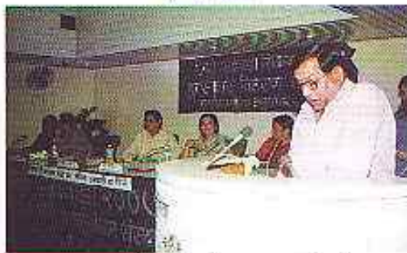
धन्यवाद ज्ञापित करते वरिष्ठ प्रशासन अधिकारी