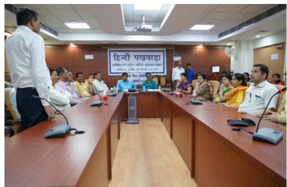
वाद-विवाद प्रतियोगिता (कर्मचारी वर्ग) में भाग लेते प्रतियोगी