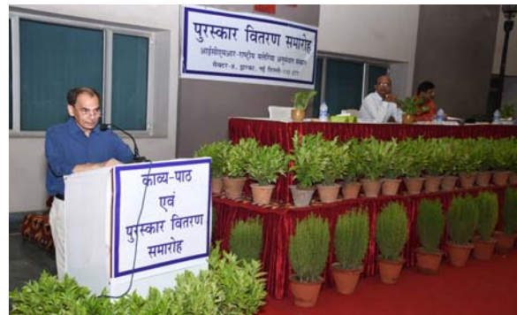
संबोधित करते हुए संस्थान के निदेशक प्रभारी