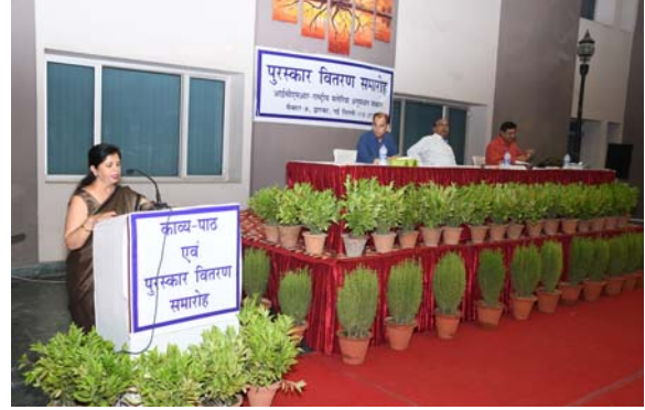
पुरस्कार वितरण समारोह का संचालन करती सहायक निदेशक (रा.भा.)