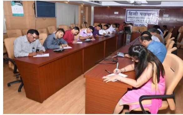
निबंध प्रतियोगिता में भाग लेते प्रतियोगी