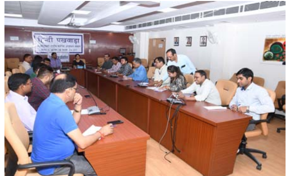
वाद-विवाद प्रतियोगिता (कर्मचारी वर्ग) में निर्णायक मंडल