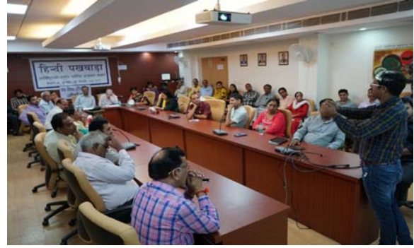
वाद-विवाद प्रतियोगिता (अधिकारी) में भाग लेते प्रतियोगी