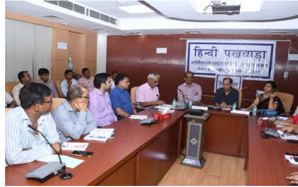
हिन्दी कार्यशाला का शुभारंभ करते निदेशक प्रभारी